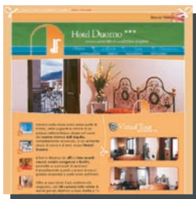
Esempio di interfaccia personalizzata [ www.hotel-duomo.it ]

Strawberr-Y è tutto questo, grazie a uno staff di grafici esperti, originali e creativi.