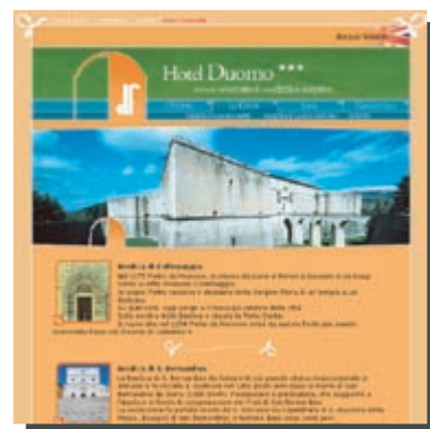
Modulo Dintorni [ www.hotel-duomo.it ]