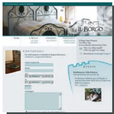
Modulo Disponibilità [ www.il-borgo.it ]